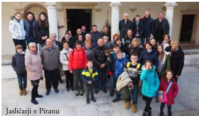
Jasličarji v Piranu

Vključevanje laikov počasi kaže sadove (izredni delivci obhajila; prostovoljci v domu in bolnišnici; veroučitelji; ministranti; čistilci in krasilci cerkve; mladina; jasličarji ...). Vse to v duhu sodobnih izzivov znotraj Cerkve, posebej v Evropi, kjer število duhovnikov zelo pada, potrebe po delu z malimi skupinami pa naraščajo (tukaj vključujem tudi zagotavljanje duhovne oskrbe za »posebne skupine«: vojska, policija, bolnišnice, domovi za starejše ... – morda je ravno tukaj novi izziv in priložnost obenem). Seveda pa bomo moč za vse to lahko črpali samo v udejanjanju besed, ki jih p. Jože Osvald vztrajno ponavlja: »Skupna molitev; skupna miza; skupna rekreacija.«