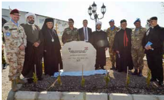
Molitev za mir v Libanonu

Božične praznike sem praznoval v Libanonu, velikonočne praznike bom praznoval v Latviji.